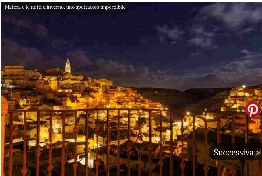
Matera e le notti d'inverno, uno spettacolo imperdibile