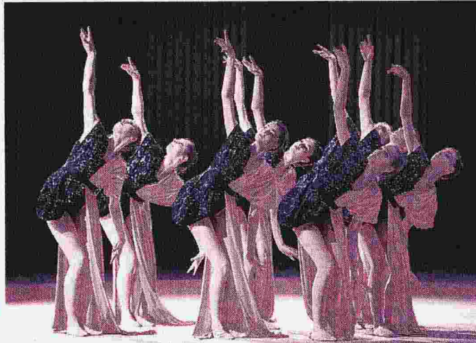
Alcuni momenti dello spettacolo delle Farfalle della ritmica a Desio, davanti a 2500 spettatori e tanti personaggi famosi GINNASTICARITMICAITALIANA