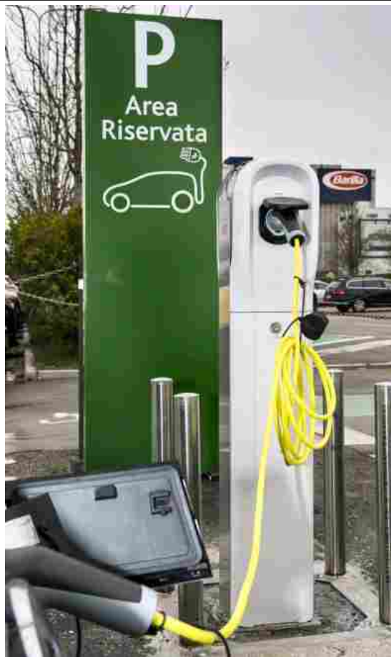
La stazione di ricarica per auto elettriche alla sede della Barilla a Pedrignano (Parma). Barilla.

Nella sua sede centrale di Pedrignano a Parma, Barilla ha installato la più grande stazione italiana per la ricarica di macchine di questo tipo.