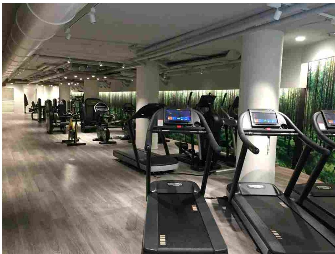
La palestra aziendale alla Vittoria Assicurazioni .

Il 71% delle imprese propone e attua un'ampia serie di piani per l'attività fisica, con varie opzioni a scelta del dipendente, che spaziano da programmi di fitness e iscrizioni in palestra, a corsi di yoga . Molte realtà hanno attrezzato un'area per lo sport. Ad esempio Vittoria assicurazioni , nei suoi locali a Milano, ha aperto una struttura di circa 450 metri quadrati, aperta dal lunedì al venerdì, a cui si può accedere in tre fasce orarie (mattina, pausa pranzo e sera) per 11 mesi all'anno.