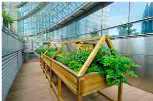
L'orto aziendale alla Unicredit Tower di Milano.

Nella Unicredit Tower di Milano sono stati realizzati appositi contenitori in cui i dipendenti coltivare erbe aromatiche e piccoli frutti e ortaggi. È possibile coltivare quello che si preferisce e recarsi all'orto in qualsiasi momento della giornata, anche se molti lo fanno durante la pausa pranzo.