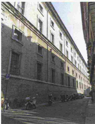
L'Università di Parma

intermediario professionale di assicurazione da parte degli studenti.