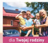
dla Twojej rodziny

od Lidera rynku mikroinstalacji fotowoltaicznych!