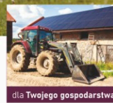
dla Twojego gospodarstwa