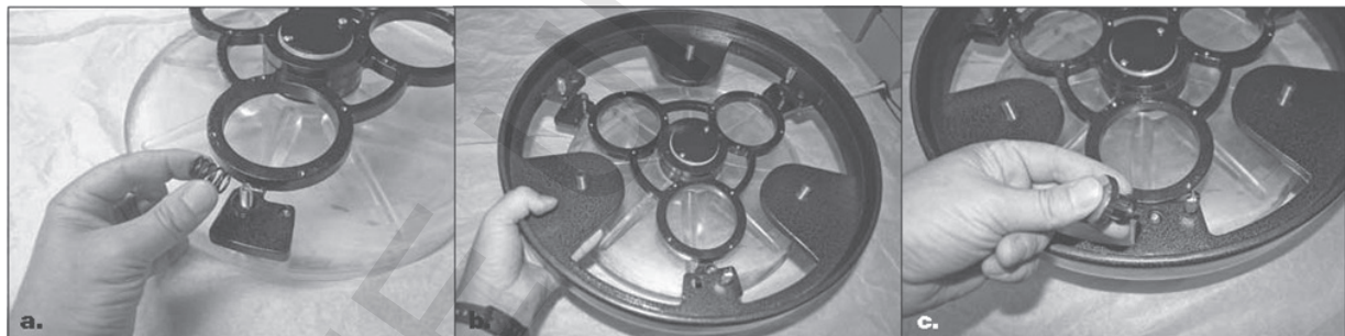
Figure 2. (a) Placez les 3 ressorts sur les vis du barillet. (b) Posez le cerclage sur les ressorts en passant au travers des 3 trous ménagés dans les pattes du support. (c) Placez les rondelles en nylon et vissez les écrous de collimation sur les 3 vis du barillet. Vérifiez que chacun des écrous moletés est vissés sur au moins 3 tours.