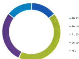
Diversiteit inzake leeftijd