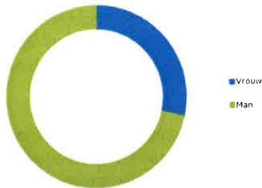
Diversiteit inzake gender

In de korte biografie van de leden van de Raad van Bestuur is meer informatie terug te vinden inzake de bekwaamheden, ervaring en deskundigheden van de leden van de Raad van Bestuur.