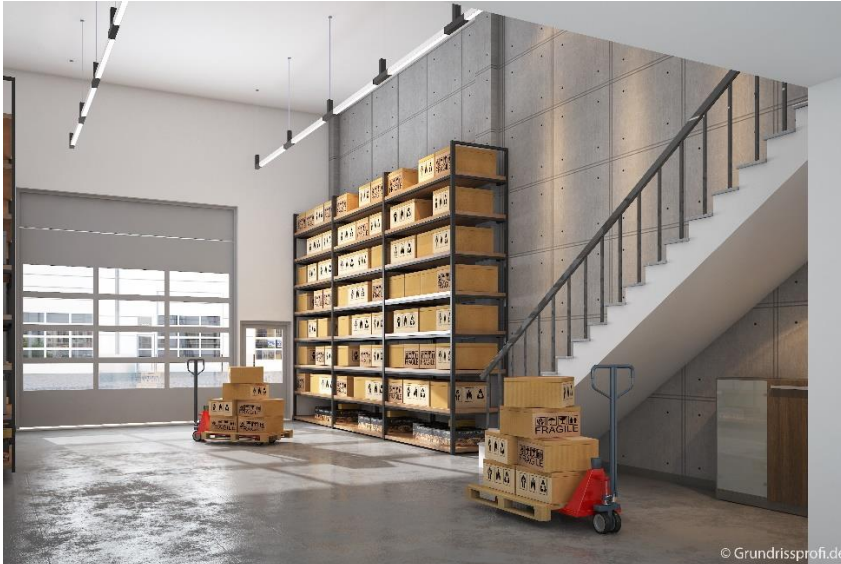
Ansicht Werkstatt, *