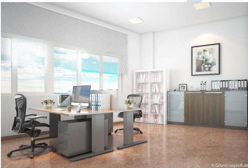
Ansicht Büro, *

Die Einheit B8 bietet einen nördlichen Ausblick. Sie verfügt über ein Büro, eigener Sanitäreinheit und einen Aufenthaltsraum mit Anschlüssen für eine Küche.