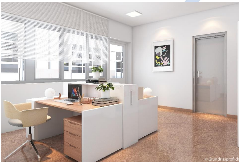
Ansicht Büro, *

Die Einheit C3 bietet einen süd-westlichen Ausblick. Sie verfügt über zwei Büros/Lagerräume, eigener Sanitäreinheit und einen Aufenthaltsraum mit Anschlüssen für eine Küche.