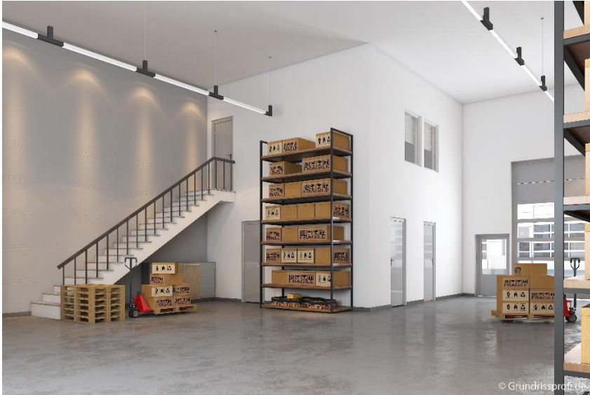
Ansicht Werkstatt, *