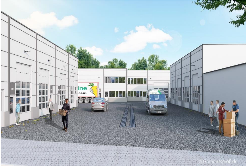
Ansicht Außen, *