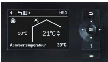
Weersafhankelijke warmtepompregeling Vitotronic 200 (type WO1C)