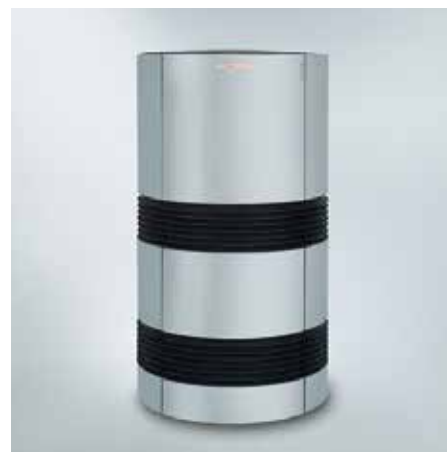
Vitocal 300-A voor installatie buitenshuis

Bijkomende besparingen op de werkingskosten zijn mogelijk door combinatie met een fotovoltaïsche installatie. De zelf opgewekte stroom kan bijvoorbeeld worden gebruikt voor de werking van de compressor, regeling, pompen en de ventilator van de Vitocal 300-A. Bovendien is de Vitocal 300-A voorbereid voor smart grid.