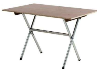
LBH 100x60x74 (4 personen)