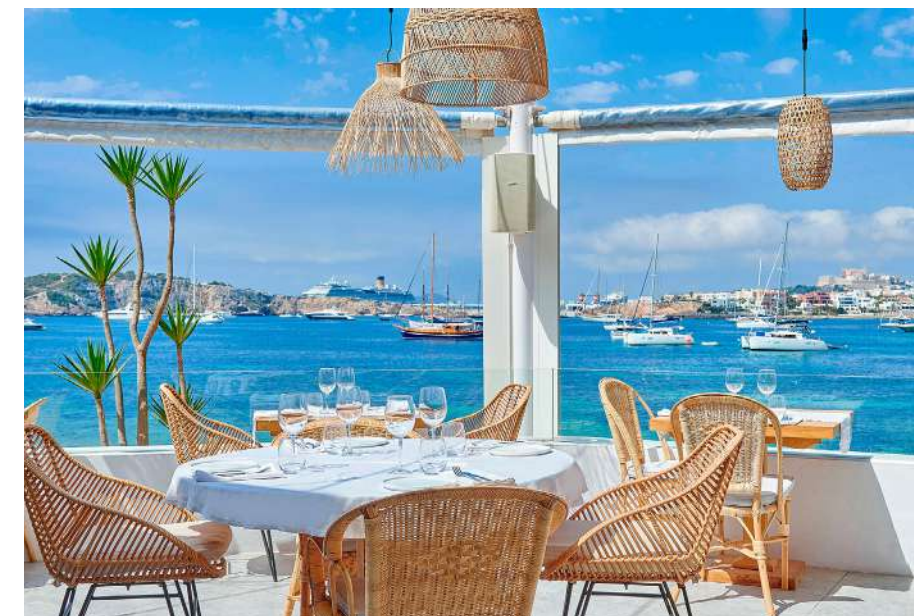
Website Sa Punta