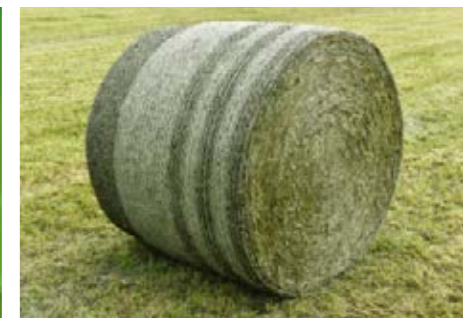
Net- of touwbinding: Fendt-rondebalepers hebben altijd een uitstekend functionerend bindsysteem.