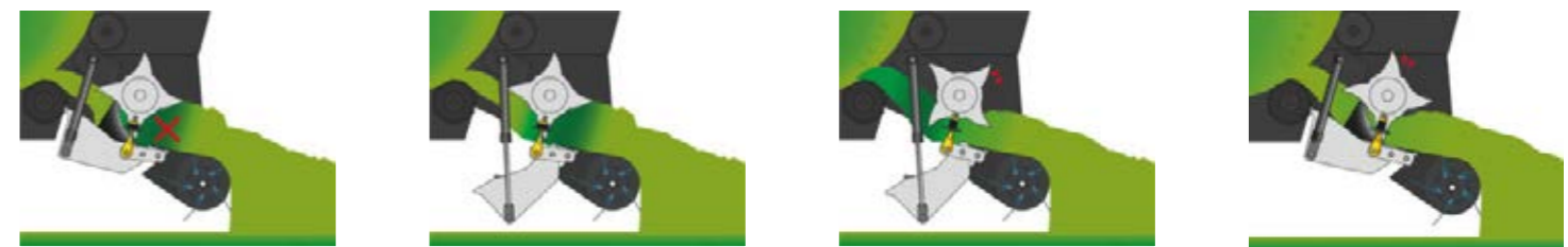
Bij verstoppingen wordt het achterste deel van de invoerbodem 500 mm neergelaten.