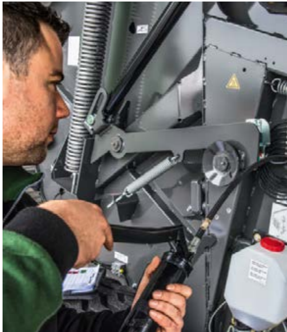
■ De smeerpunten zijn samengevoegd tot een smerlijst, waardoor smeren weinig tijd kost.

Doordacht tot in de kleinste details, zodat bij u alles soepel loopt.