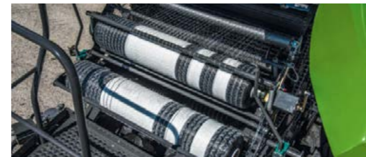
Met behulp van het EasyLoadSysteem is in een handomdraai een nieuwe netrol te plaatsen.