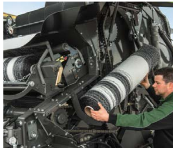
■ Netrollen zijn snel en gemakkelijk in de voorraadbak te plaatsen, zodat u altijd genoeg rollen bij u hebt.