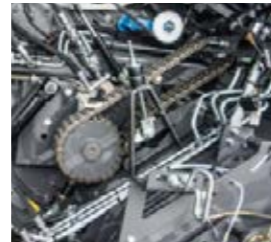
■ De hoeveelheid olie waarmee de kettingen worden gesmeerd, is instelbaar.