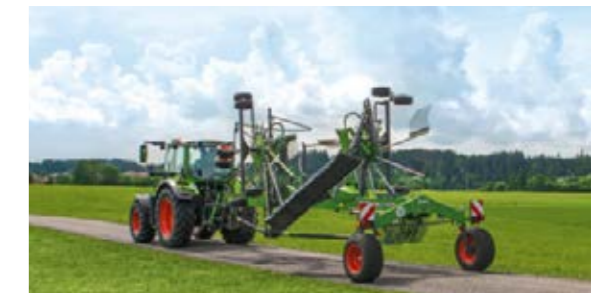
Le contrôle de séquences soulève toujours la toupie de l'andaineur Fendt Former dans la bonne séquence en bout de champ.