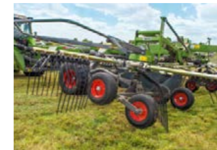
Lors de la descente en bout de champ, ce sont les roues arrière qui entrent en premier en contact avec le sol, puis celles avant. Lors du levage, les toupies sont soulevées à l'avant en premier. Cet effet Jet protège le tapis végétal.