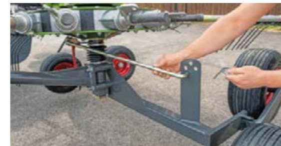
Que le fourrage soit long et lourd ou court et léger : le chemin de cames peut être ajusté facilement en fonction des conditions de récolte.