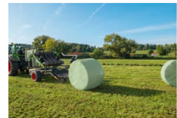
La Rollector 160 est équipée d'une table de déchargement des balles à éjection active – une protection efficace contre l'endommagement du film.