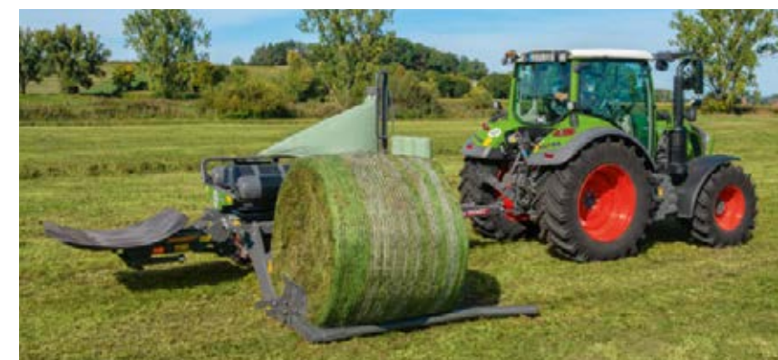
Le bras de chargement et la table d'enrubannage peuvent tous deux être adaptés à différentes tailles de balles. Ramassez en toute sécurité des balles de 1,25 m à 1,6 m de diamètre et enrubannez-les dans un film hermétique.