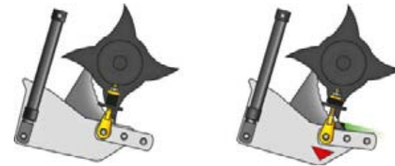
La fonction FlexControl empêche de façon fiable les bourrages.

La première fonction, appelée fonction « Flex », correspond à la suspension permanente du fond de rotor. Des ressorts sont utilisés pour amortir le fond du canal de haut en bas afin de pouvoir réguler les fluctuations de fourrage. La deuxième fonction est la fonction « Hydro ». Le fond du rotor peut être ouvert hydrauliquement de l'intérieur de la cabine grâce à deux vérins hydrauliques, sur simple pression d'un bouton, ce qui permet de libérer le rotor de tout blocage ou de changer les couteaux. L'HydroflexControl permet ainsi d'utiliser la machine sur une longue durée tout en garantissant un débit élevé.