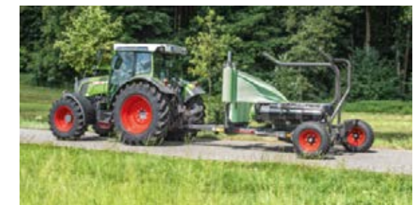
La Fendt Rollector enrubanne des balles de 0,90 m à 1,30 m de diamètre.