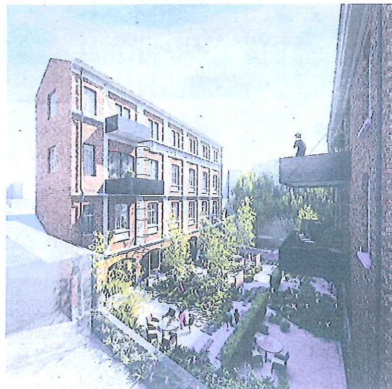
Impressie van de lofts en de gemeenschappelijke binnentuin.

Het Brusselse Architectslab tekende het plan voor de renovatie van de site, die opgedeeld werd in twee gescheiden gedeeltes. In een U-vormig gebouw langs de straatkant komen 45 studentenkamers en acht studio's. Meer dan 300 vierkante meter is uitgetrokken voor gemeenschappelijke ruimte, zoals keukens en riante ontspanningszaal in de kelderverdieping.