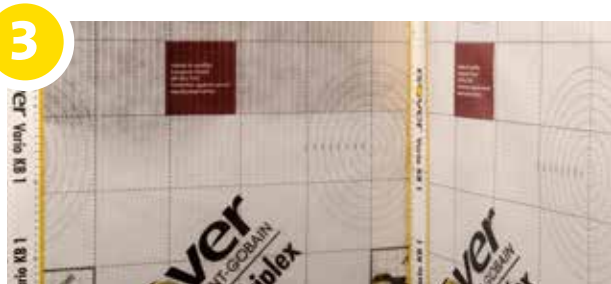
De verschillende banen van de Vario KM Triplex dienen elkaar ruimschoots te overlappen (minstens 15 cm). Daar waar de Vario KM Triplex vastgeniet werd of waar twee banen mekaar overlappen, wordt er vervolgens de eenzijdige kleefband, Vario KB1 , geplaatst zodat de luchtdichtheid verzekerd wordt.