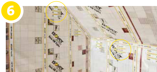
Kleef de inblaasopening af met de ISOVER Vario KB1 Patch (16 cm x 16 cm) om de luchtdichtheid te garanderen. Vervolgens afwerking plaatsen op houten latten of metalen profielen.