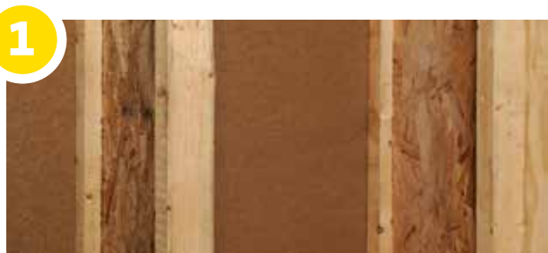
Basisconstructie: houtstructuren en houtskeletbouw, zoals bijvoorbeeld TJI-liggers