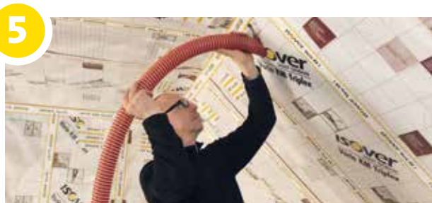
Vul de spouw met ISOVER Insulsafe Plus Wood met een densiteit van 35 kg/m 3 , zowel verticaal, horizontaal, als in helling.