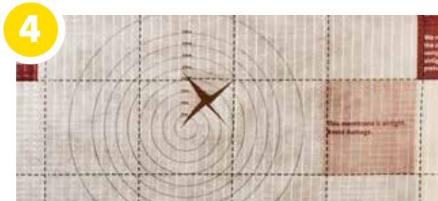
Maak een opening/kruis van 10 cm zodat de inblaasslang ingebracht kan worden.