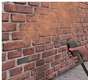
2 Reinigen van de boorgaten

Boor gaten op een afstand van 12 cm op één rij, met een diameter van 14 mm.