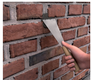
4 Vullen van de boorgaten

Vul het boorgat met Humabloc® Plus door middel van een handpistool, injectielans of Desoi pomp.