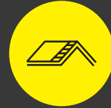
Dak: isolatie en renovatie

In Mijn VerbouwPremie vindt u premies in 10 categorieën: