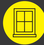
Ramen en deuren: glas en buitenschrijnwerk