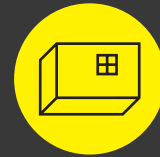
Binnenrenovatie: binnenmuur, plafond en trap