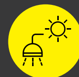
Hernieuwbare energieproductie: warmtepomp, warmtepompboiler, zonneboiler