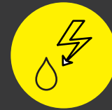
Elektriciteit en sanitair