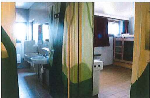
salle de bain + chambre