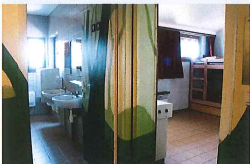
badkamer + kamer