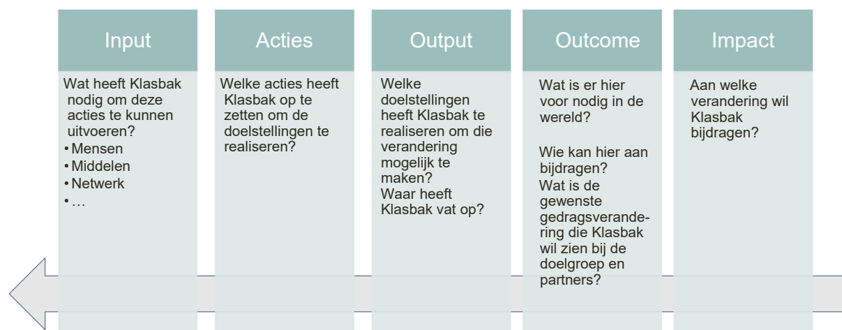
Figuur 2. Impact chain