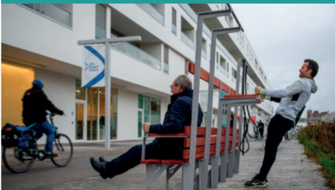
Balk van Beel - Leuven (B)