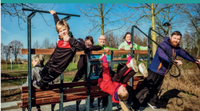
Kuringen - Hasselt (B)