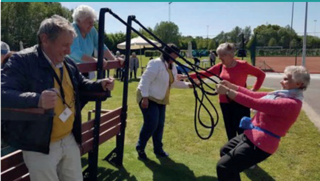
Sporteldag Volkssportennamiddag - Balen (B)