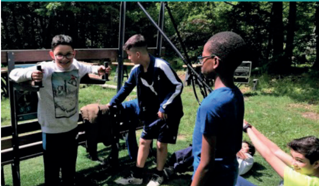
Schoolsportdag - Affligem (B)