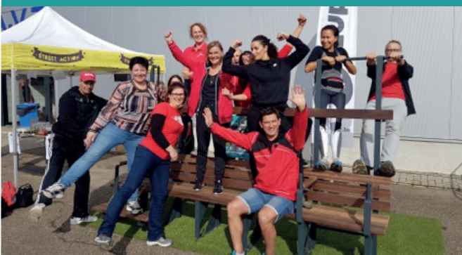
Ambtenarensportdag - Heusen-Zolder (B)