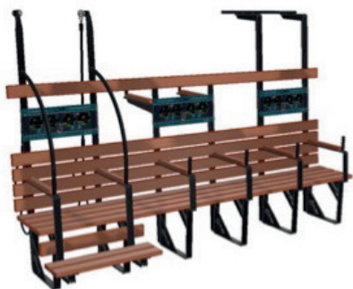
Beweegbank Senior (B)