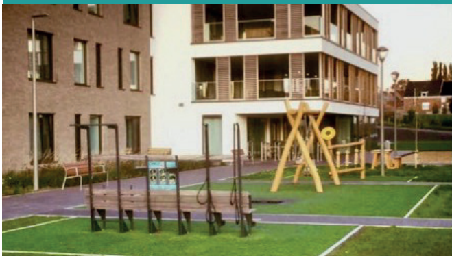
WZC De Zon - Kortrijk (B)