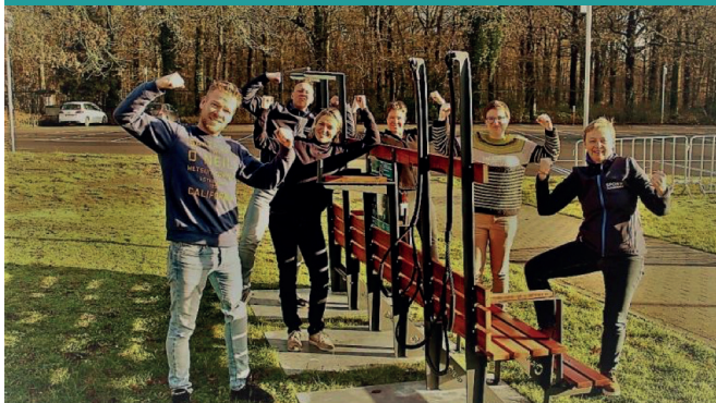
Natuurloop Peerdsbos - Brasschaat (B)