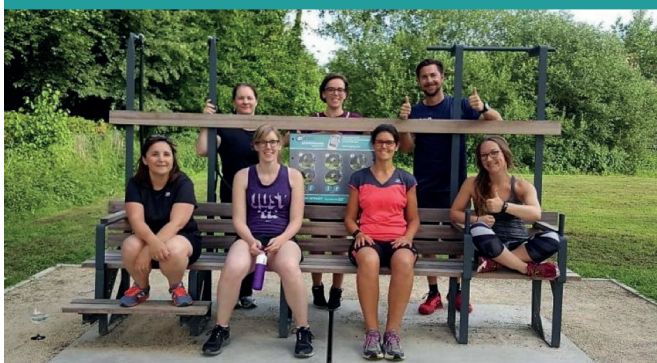
Finse piste Prinsenhof - Kuringen (B)