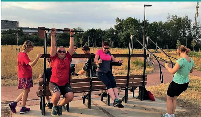
Finse piste Molenveld - Herent (B)