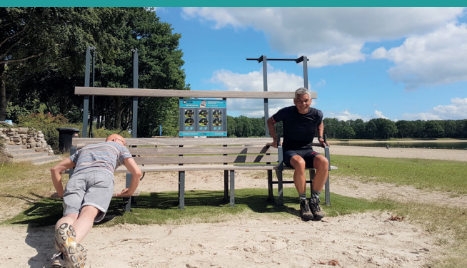
Camping Ronostrand - Noordenveld (NL)