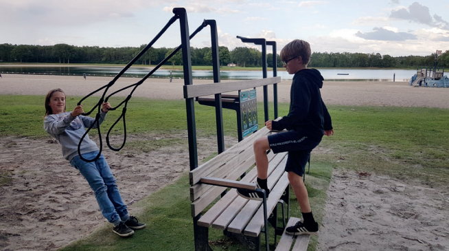
Camping Ronostrand - Noordenveld (NL)