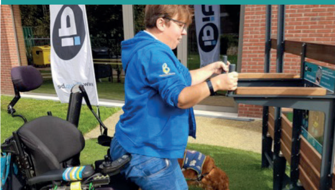
Crowdfunding - G-Sport Vlaanderen (B)