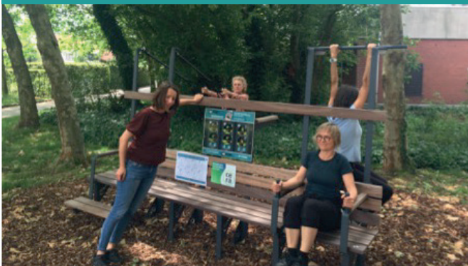
Psychiatrische centrum Sint-Emmaüs - Duffel (B)