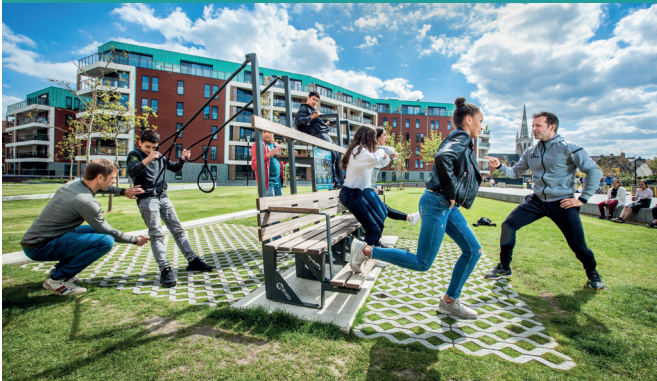
Beweeglint - Leuven (B)