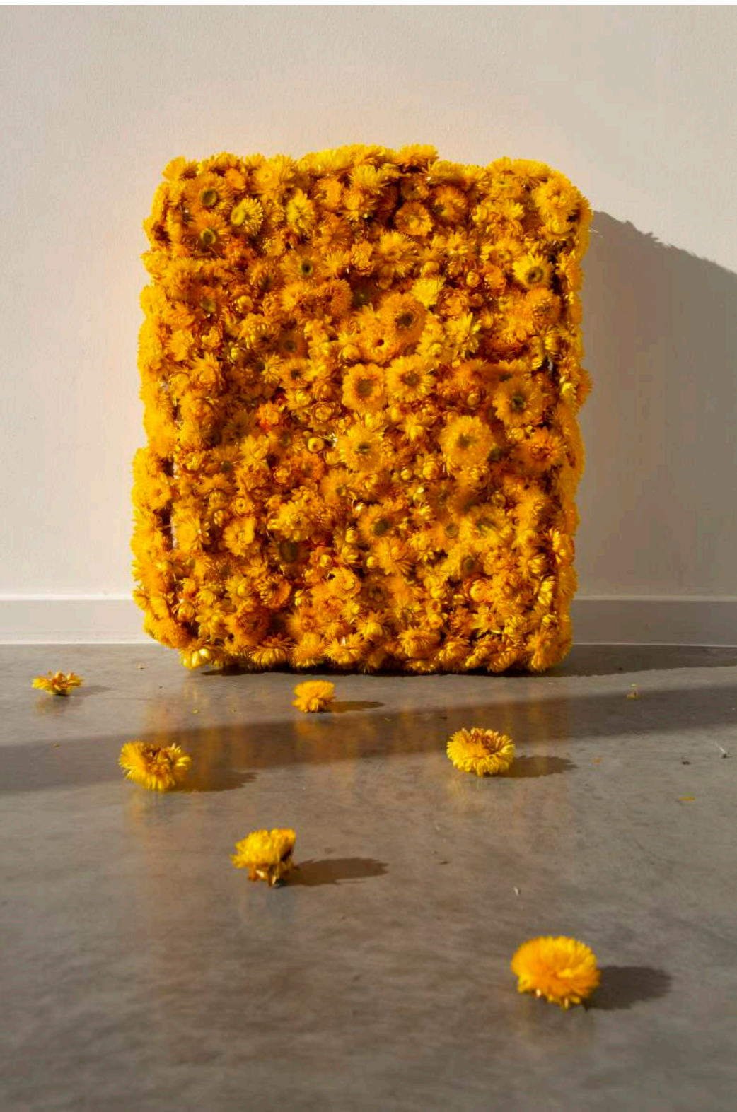
Muurcreatie in Helichrysum