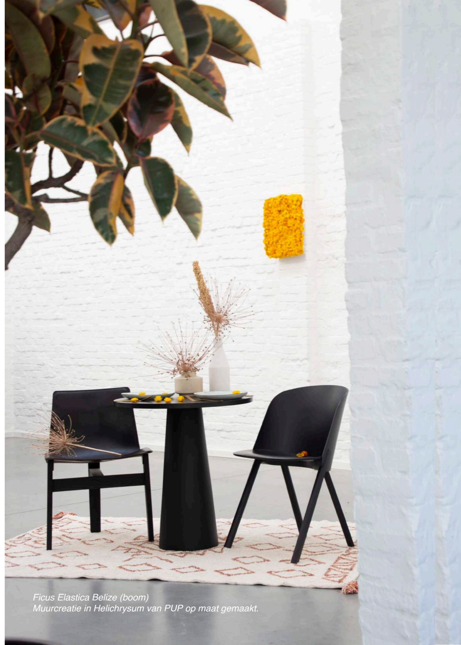
Ficus Elastica Belize (boom) Muurcreatie in Helichrysum van PUP op maat gemaakt.