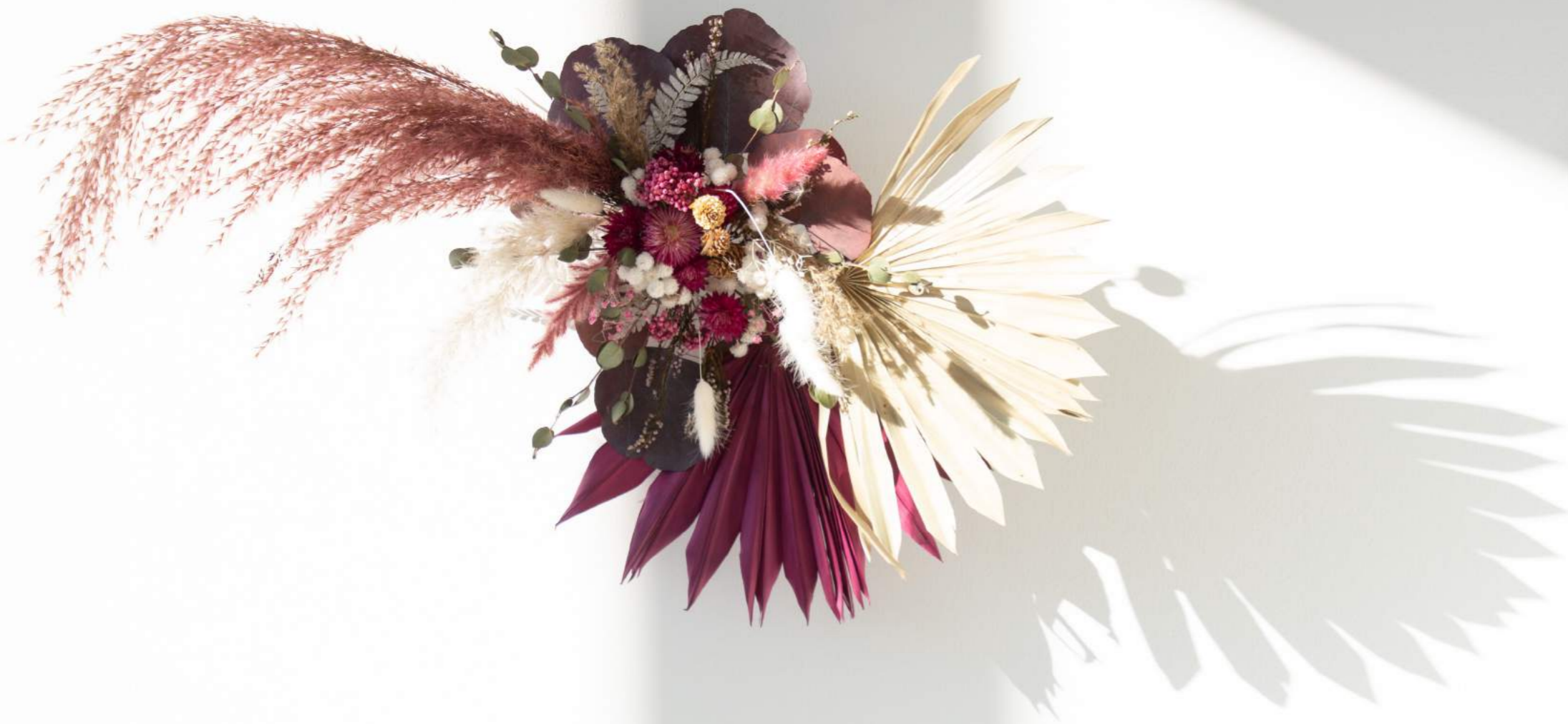
Wall Bouquet "Lilly"