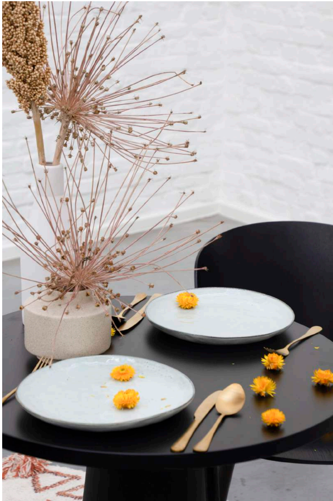
Accessoires: KIM. Interior Design