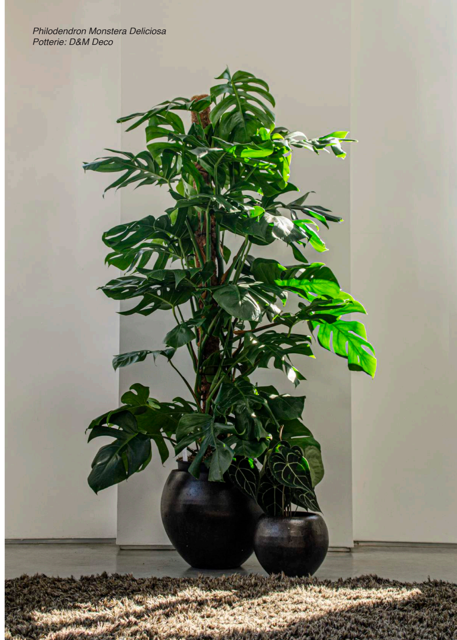
Philodendron Monstera Deliciosa Potterie: D&M Deco