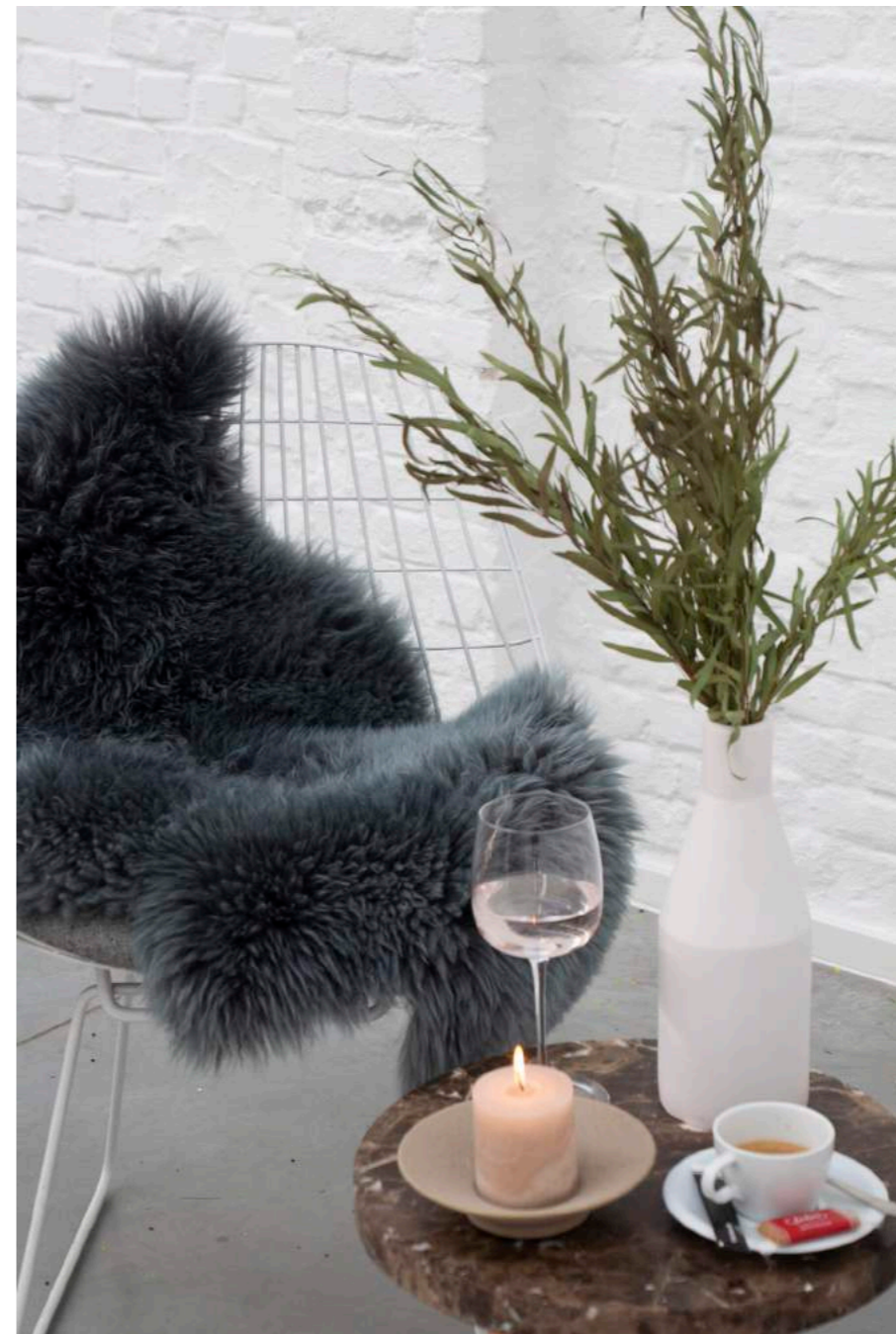
Wall Bouquet "Ayana", muurcreaties van PUP op maat gemaakt.