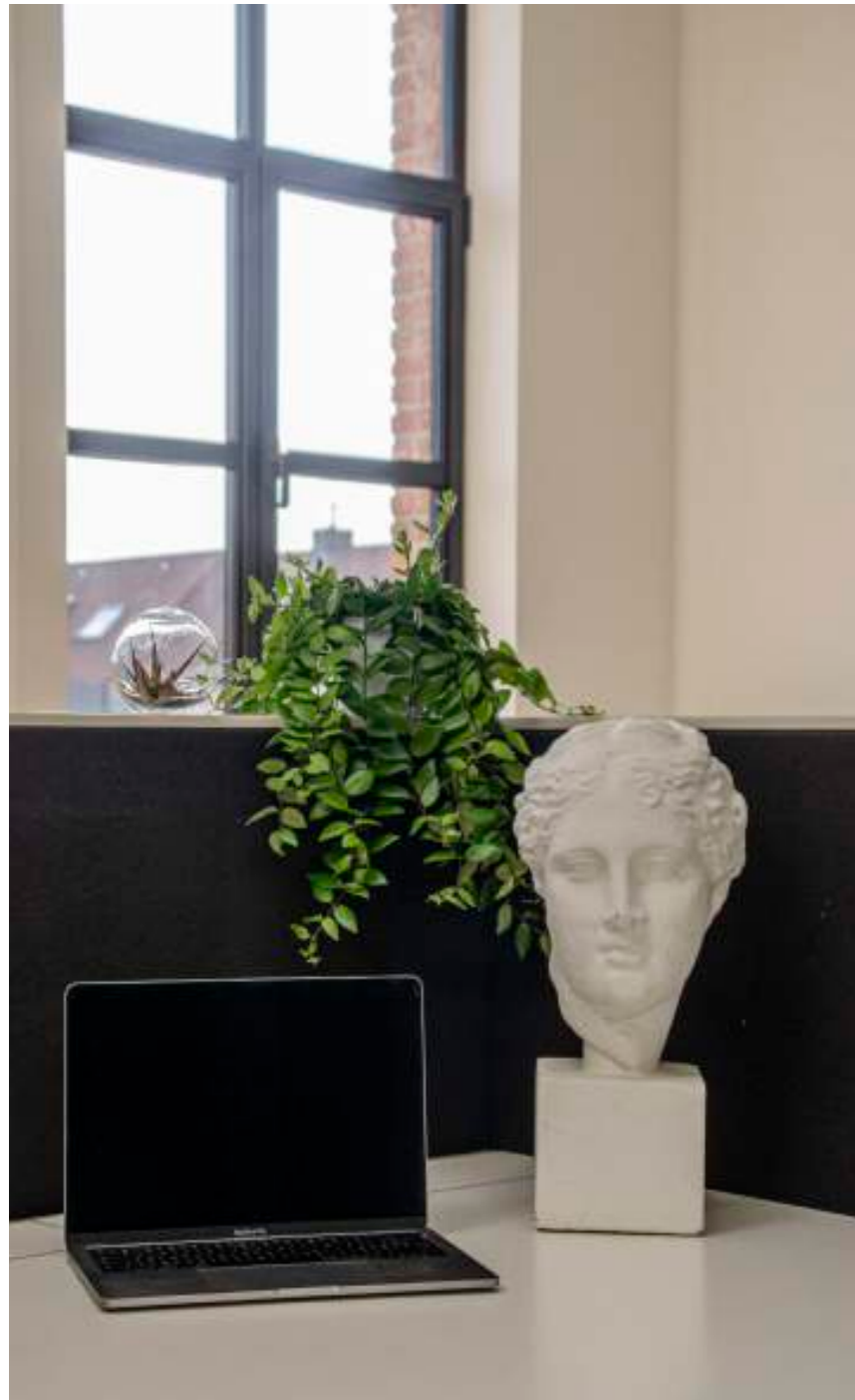
Aeschynantus Mona Lisa (hangplant)