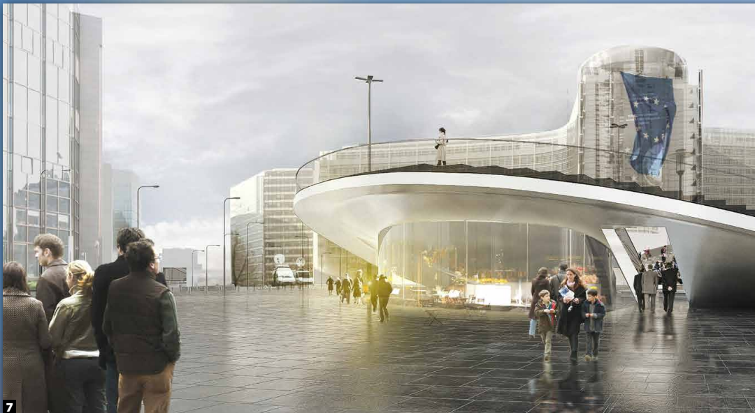
7 BXL / Rond punt Schuman