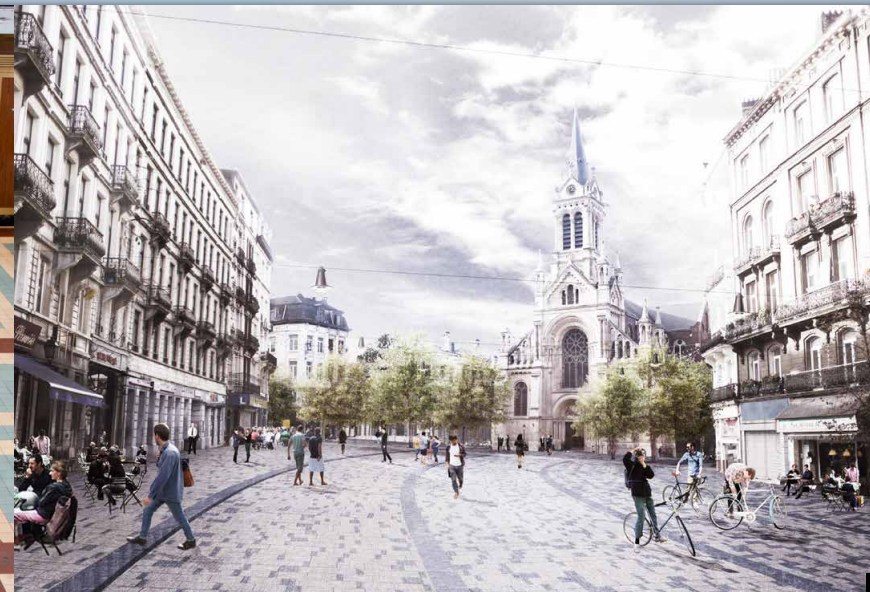
5 BXL / Kerkplein Sint-Gillis 6 BXL / Tunnel Maelbeek