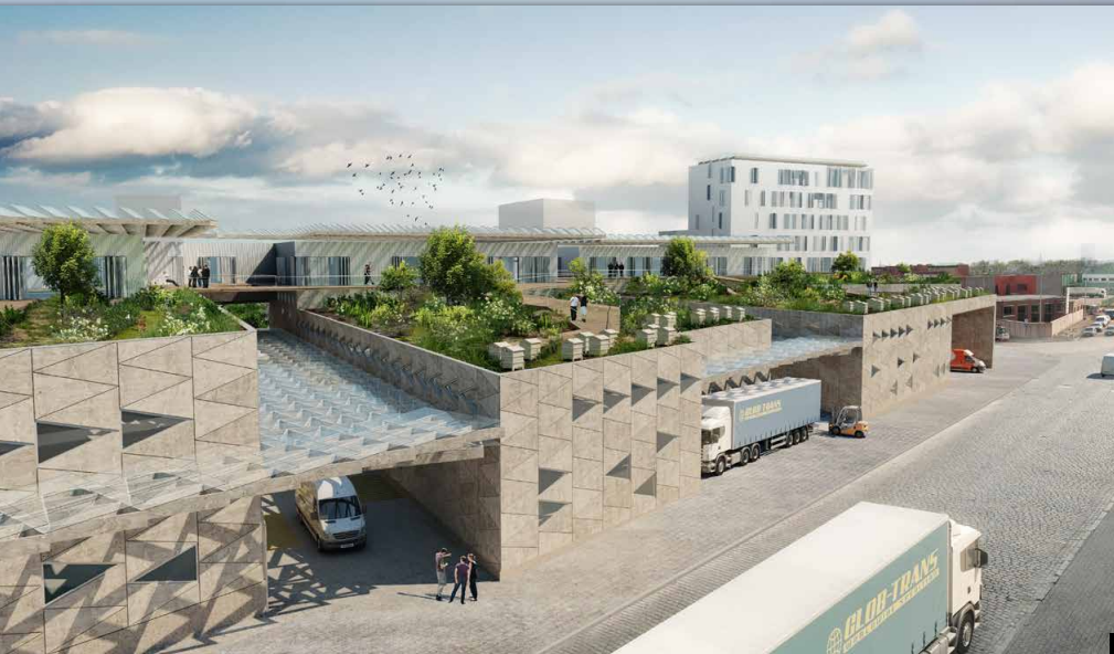
8 BXL / Tuinen Greenbizz