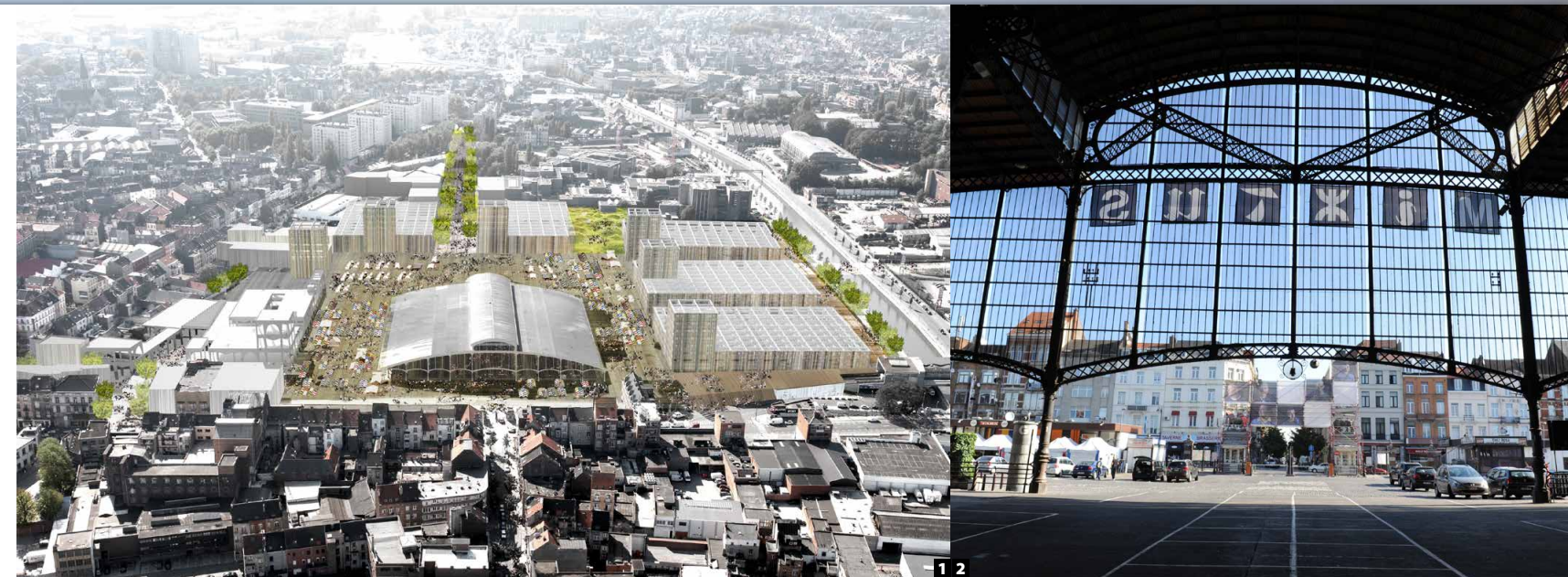
1 BXL / Perspectief Slachthuisite 2 BXL / Slachthuizen

[MM] Olivier, jij hebt je ook laten inspireren door wat er in Vlaanderen gebeurde?