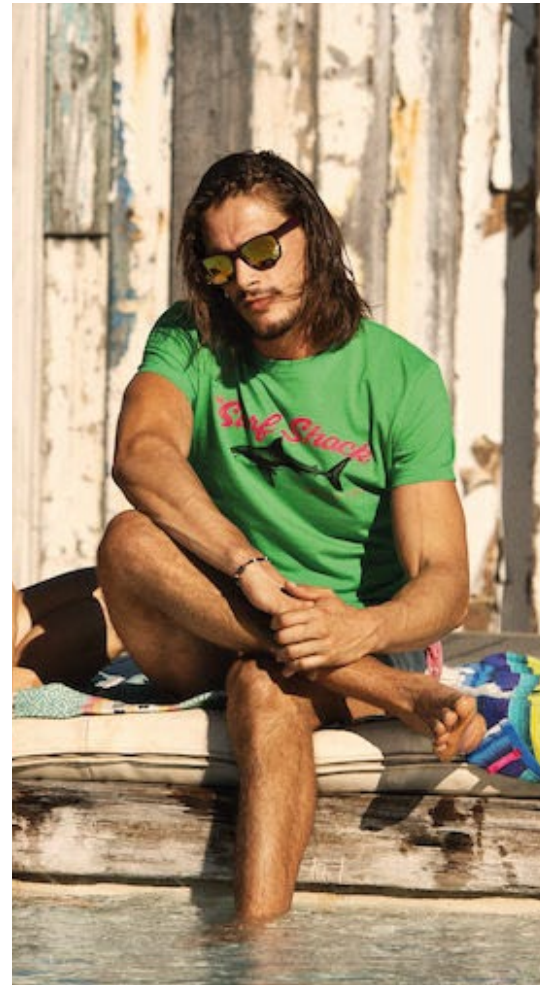
Light T-shirt RSX Printer 2264027 Light T-shirt Lady Printer 2264028 100% Oeko-Tex coton 140 g/m 2