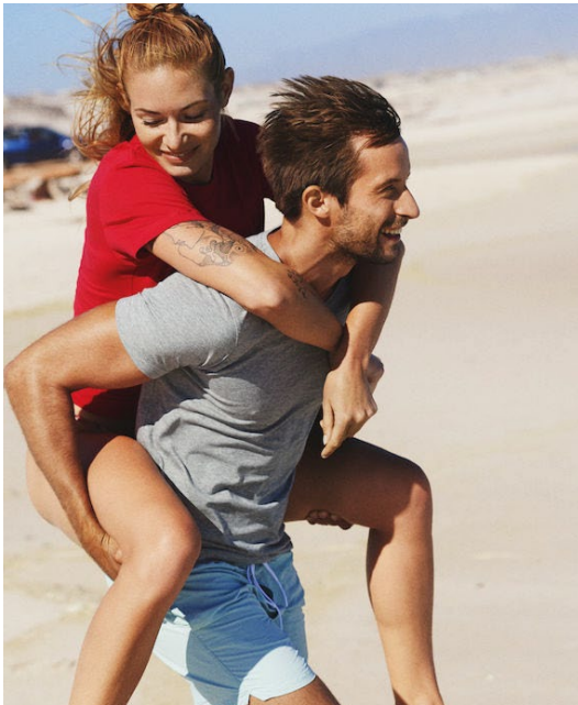
Heavy T-shirt RSX Printer 2264020 Heavy T-shirt Lady Printer 2264014 100% Oeko-Tex coton 160 g/m 2

Ceci est une sélection de notre collection, d'autres marques, modèles et coloris sont possibles, demandez-le.