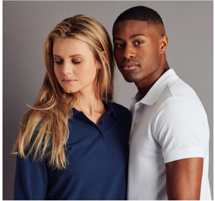
Surf Pro Rsx Polo Pique Printer 2265019 Surf Pro Lady Polo Pique Printer 2265014 60% coton 40% polyester, 200 g/m 2