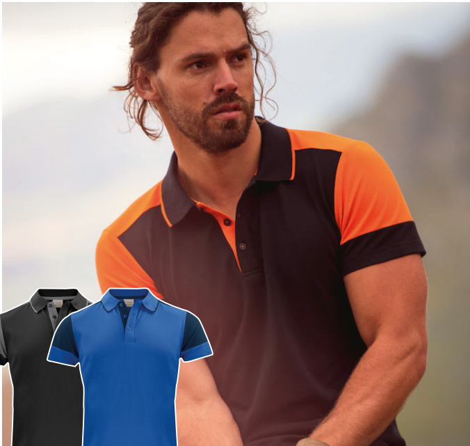
Surf Stretch Printer 2265020 Surf Stretch Lady Printer 2265021 95% coton 5% elasthanne 200 g/m 2