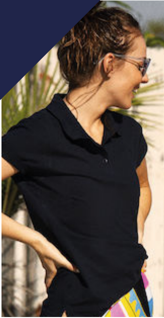
Surf Light RSX Printer 2265022 Surf Light Lady Printer 2265023 100% coton 180 g/m 2

Ceci est une sélection de notre collection, d'autres marques, modèles et coloris sont possibles, demandez-le.