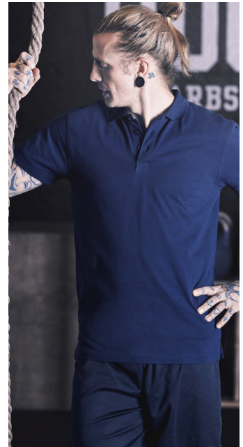
Prime Polo Printer PRIME 2265024 Prime Polo Lady Printer PRIME 2265025 50% coton organic 50% polyester recyclé 200 g/m 2