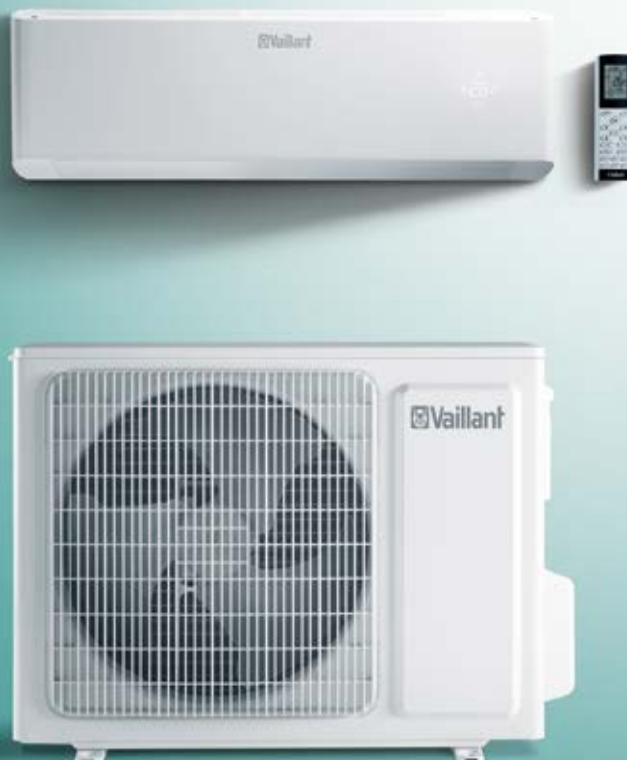
climaVAIR wandmodel, afstandsbediening en buitenunit

Optimaal interieurklimaat en efficiëntie in alle seizoenen