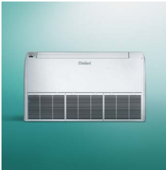
climaVAIR vrijstaand vloer- of wandmodel