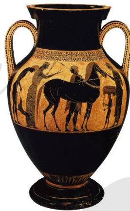
Oud-Griekse amfoor van de hand van Exekias, 540 – 530 vóór Christus, Vaticaanmuseum.