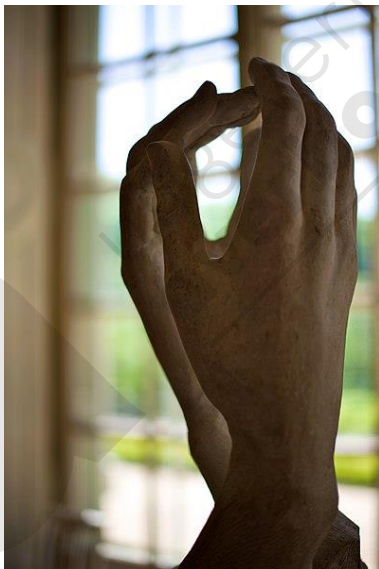
Auguste Rodin, De kathedraal , 1908.

17. Vergelijk het werk van Auguste Rodin (1840-1917) met dat van Antoine Pevsner (1884-1962).