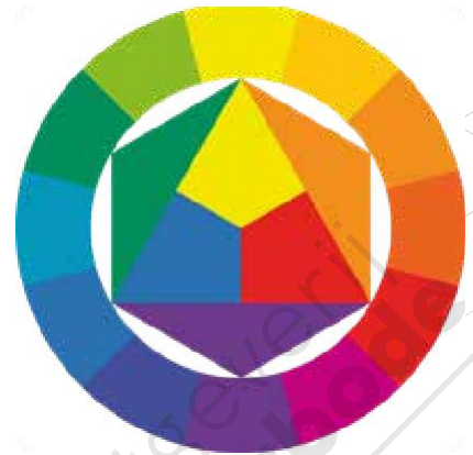
Johannes Itten, Kleurencirkel, 1961

De secundaire kleuren ontstaan door twee van de drie primaire kleuren in gelijke hoeveelheden met elkaar te mengen.