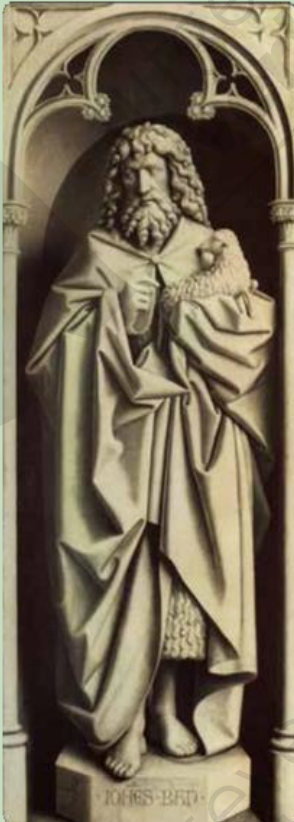
Hubert Van Eyck, Johannes de Doper, Detail van de gesloten panelen van het Lam Gods, 1430-1432