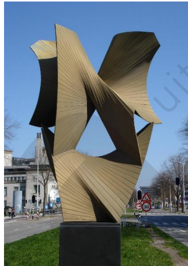
Antoine Pevsner, Construction dans la troisième et la quatrième dimension , 1969, Den Haag