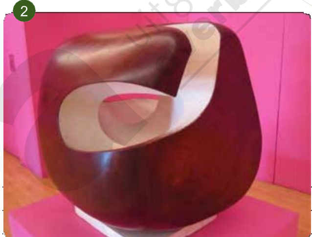
Barbara Hepworth, Corinthos, 1954-1955

We onderscheiden twee soorten vormen: geometrische en organische, biomorfe vormen .