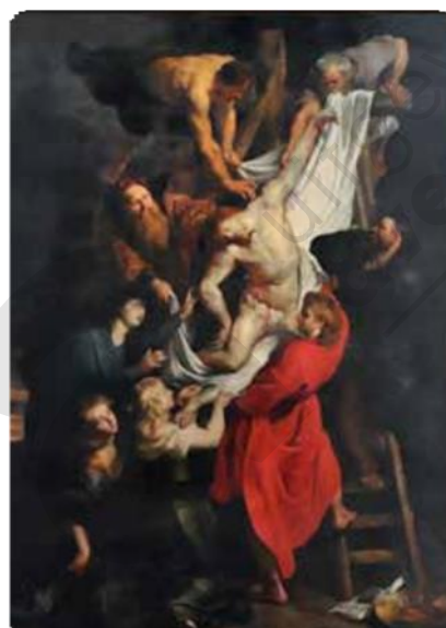
Pieter Paul Rubens, De kruisafneming, fragment, 1611-1614