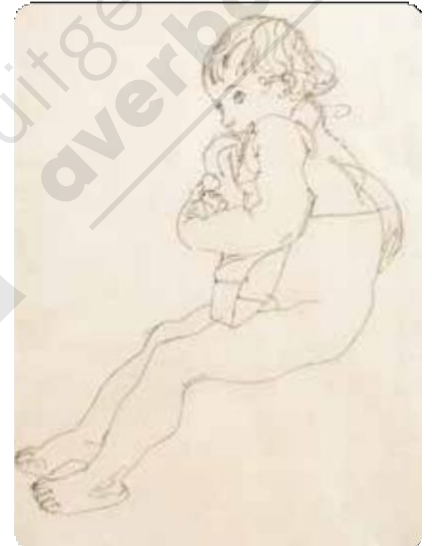
Egon Schiele, Zittend kind, 1916