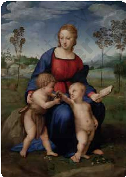
Rafael, Madonna met de distelvink, 1506