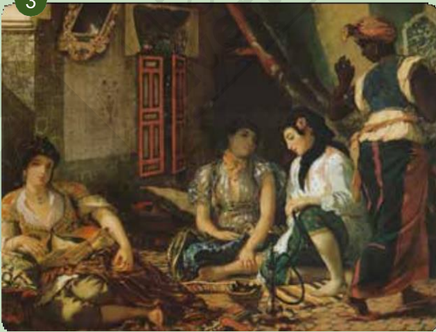
Eugène Delacroix, Algerijnse vrouwen, 1834