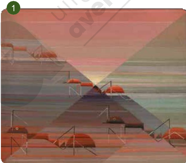
Felix de Boeck, Mieren (Genesis), 1923