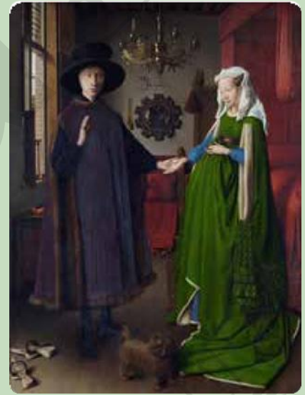
Jan van Eyck, Portret van Giovanni Arnolfini en zijn vrouw, 1434

Ook de tussenkleuren kunnen elkaars complementaire kleuren zijn. Zo is blauwgroen de kleur tussen blauw en groen. Het is ook de complementaire kleur van de kleur die tussen oranje (de complementaire kleur van blauw) en rood (de complementaire kleur van groen) ligt. Door complementaire kleuren naast elkaar te zetten, ontstaat een heel sterk contrast.