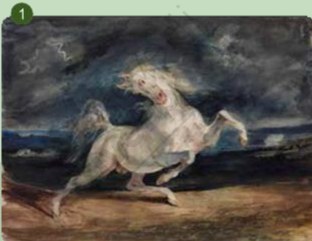
Eugène Delacroix, Paard bang door een storm, 1824