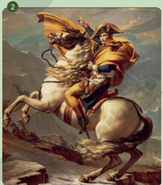
Jacques-Louis David, Napoleon steekt de Alpen over, 1801