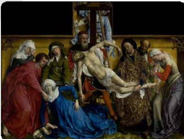
Rogier van der Weyden, De kruisafneming, 1435-1438

Rogier van der Weyden (1399/1400-1464) was een van de Vlaamse Primitieven. Die kunstschilders waren de eersten om te werken met olieverf op een houten paneel. Ze waren tijdens de 15e eeuw actief in Gent, Brugge, Leuven, Doornik en Brussel. Hun gedetailleerde stijl om de werkelijkheid weer te geven was erg vernieuwend. De olieverf zorgde voor reflectie van het licht in de verflagen en liet ook toe om heel gedetailleerd te werk te gaan.