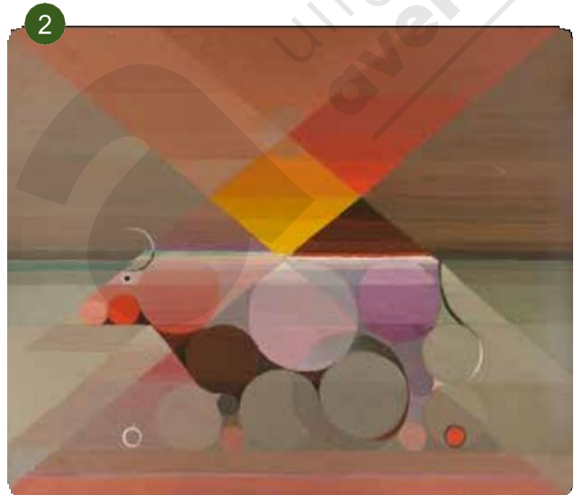
Felix de Boeck, De stier (Genesis), 1923