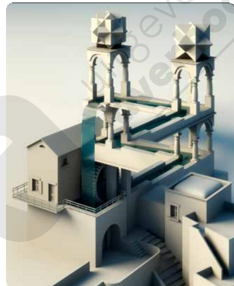
Reproductie van M.C. Escher, De waterval

Escher weet de perspectiefregels zelfs zo toe te passen, dat hij ons op het verkeerde been zet. Hij doet dat door de onmogelijke driebalk toe te passen, een principe dat in de wiskunde niet realiseerbaar is. Gelukkig kan dat in de kunst wel.