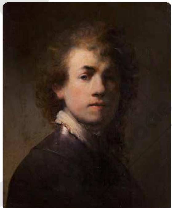
Rembrandt van Rijn, Zelfportret, ca.1629