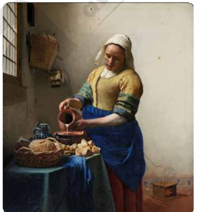
Johannes Vermeer, Het melkmeisje, 1658