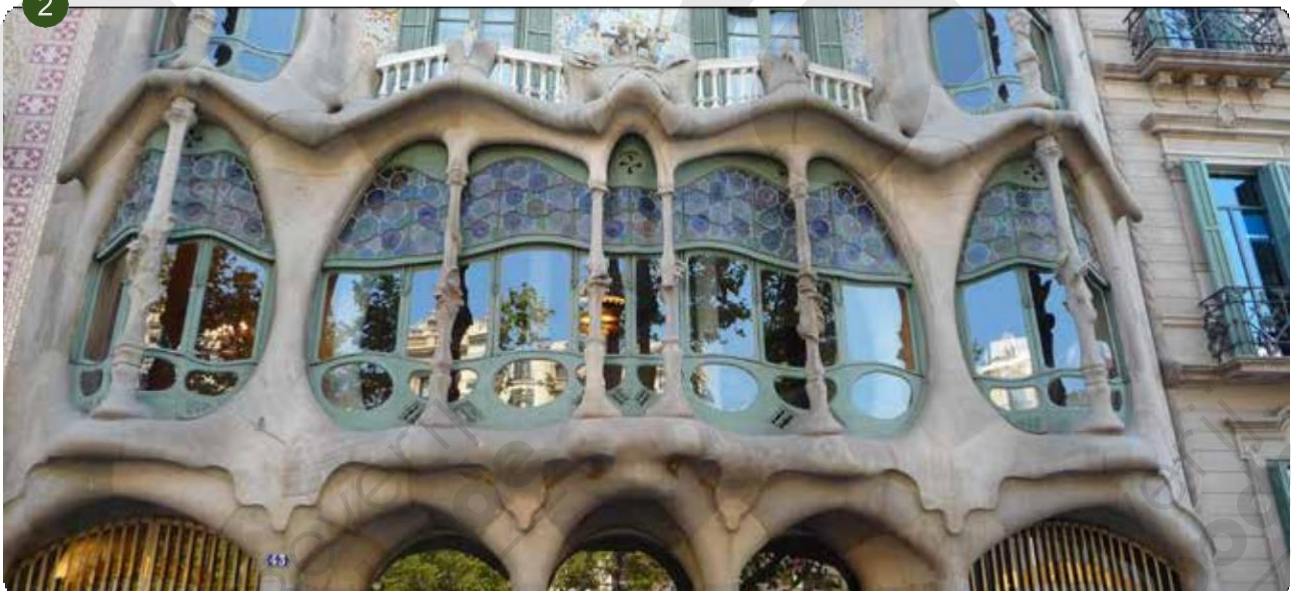
Antoni Gaudí, Casa Batlló, Barcelona, 1877 (renovatie 1904)