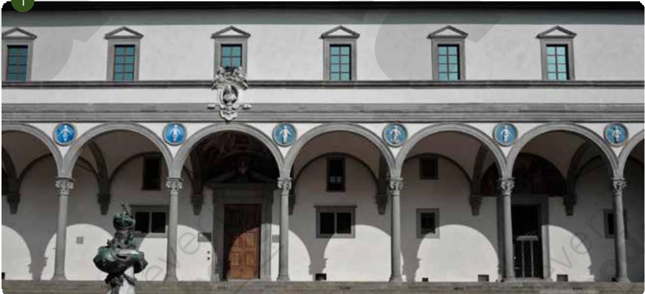
Filippo Brunelleschi, Ospedale degli Innocenti, Firenze, 1419-1445