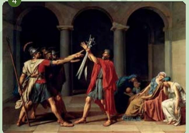
Jacques-Louis David, Eed van de Horatii, 1784-1785