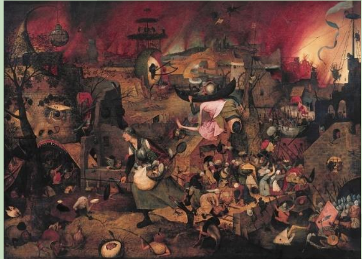
Pieter Bruegel de Oude, De Dulle Griet, 1563

Op basis van de plaats die de figuren ten opzichte van elkaar innemen, is er ook een onderscheid mogelijk tussen een symmetrische en asymmetrische compositie.