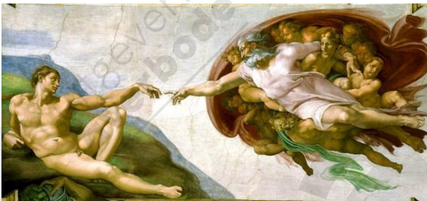
Michelangelo, De schepping van Adam, 1511