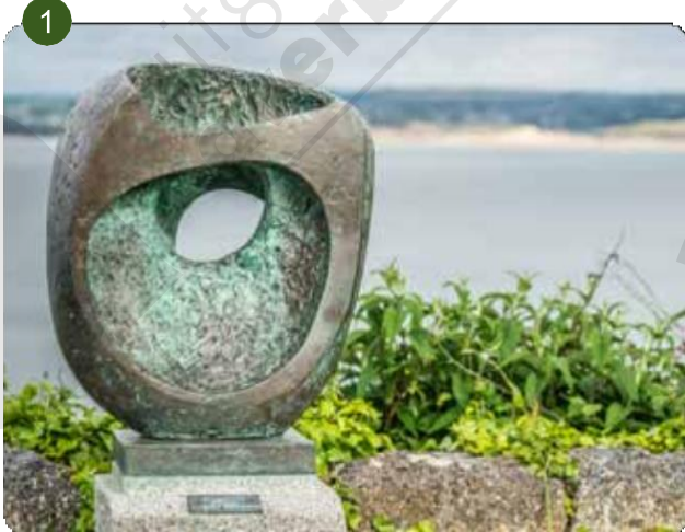
Barbara Hepworth, Epidauros II, 1961, St Ives