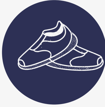
TURNPANTOFFELS OF SPORTSCHOENEN MET WITTE ZOOL