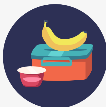
BROODDOOS EN FRUITDOOS