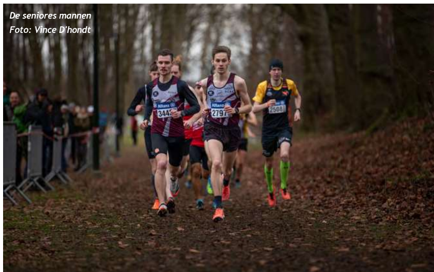
De seniores mannen