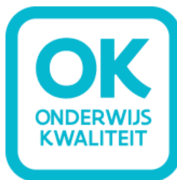
Kwaliteitsvol onderwijs voor iedereen