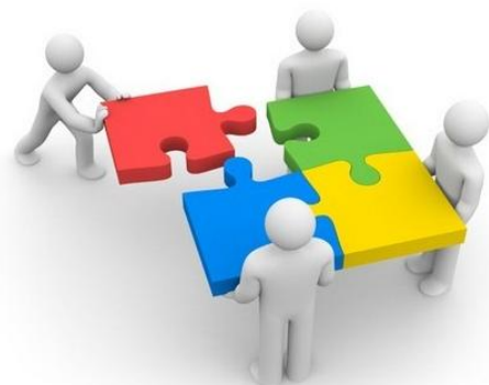
Samen met onze ouders