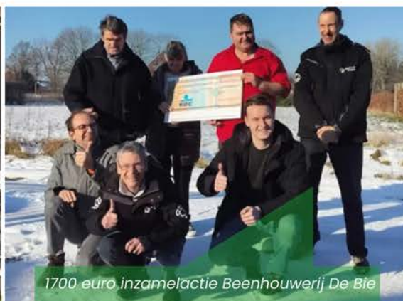
1700 euro inzamelactie Beenhouwerij De Bie