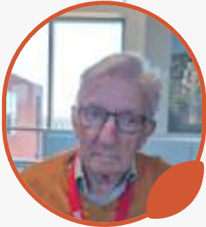
Dhr. Jef V.D.B. Brug 2, kamer 268 Overleden op 5 maart 2026 .

Je bent niet meer daar waar je was maar overal waar wij zijn