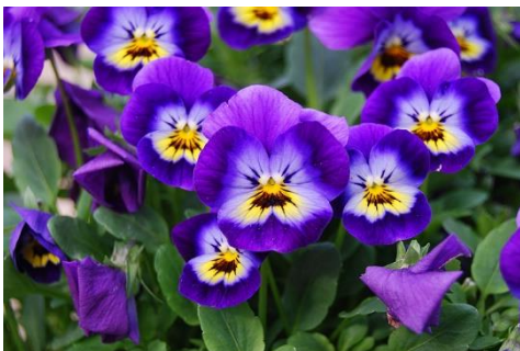
Ghislaine SF 010

Met een leuke prijs voor alle deelnemers zijn we dankbaar huiswaarts gekeerd.