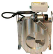
ELEKTR. KETTINGSCHAAF MET BESCHERMBAK