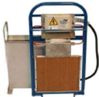
LASSPIEGEL MET BESCHERMBAK