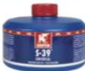
GR S-39 320 ml