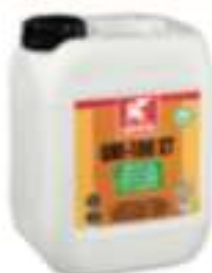
GR UNI-100 XT CAN 5 l