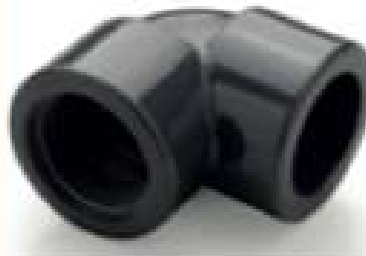
Transition Elbow 90°