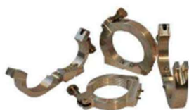
SUPPORTS DIA 90 MM SUPPORTS DIA 110 MM SUPPORTS DIA 125 MM SUPPORTS DIA 160 MM SUPPORTS DIA 180 MM SUPPORTS DIA 200 MM

GL578725 GL578461 GL578462 GL578463 GL578437 GL578465