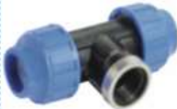
Female Tee 90°