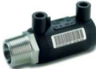
Male transition socket