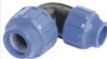
Reducer Elbow 90°