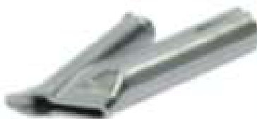
Speed welding nozzle