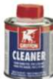
PVC Cleaner 500 ml