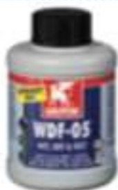
GR WDF-05 Bottle 500 ml