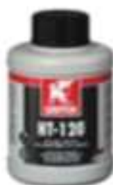
HT-120 Flacon 500 ml