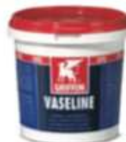
GR Vaseline 1 kg Pot