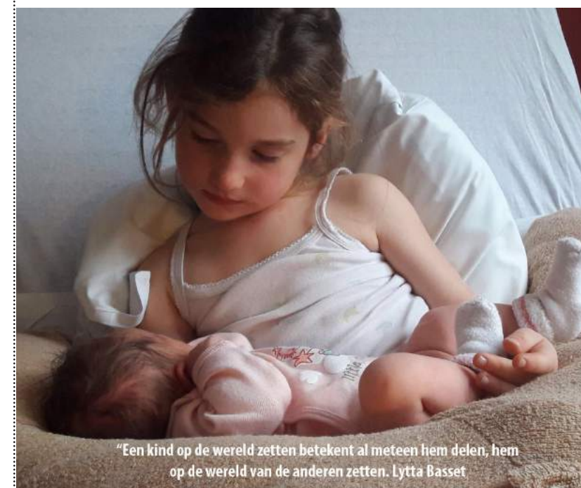
“Een kind op de wereld zetten betekent al meteen hem delen, hem op de wereld van de anderen zetten. Lytta Basset

Ik herinner mij hoeveel concentratie het vroeg om mijn locomotiefje op de sporen te zetten, alle wielletjes op exact de juiste