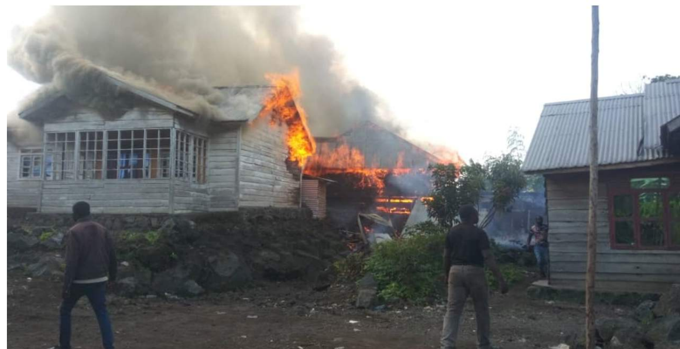
Regelmatige conflicten met de milities in Goma en omgeving, april 2021