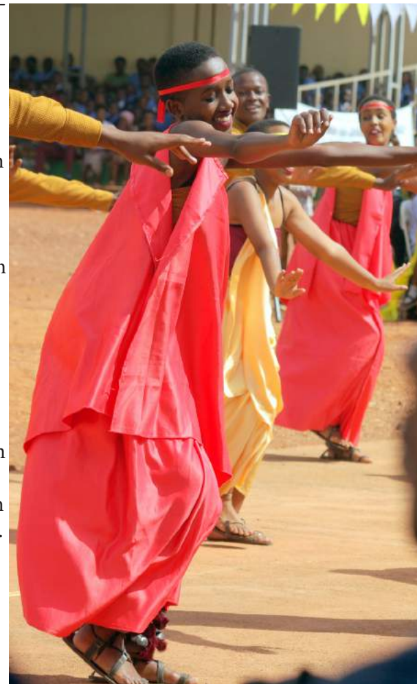
De foto staat los van het artikel

Ik was met twee vriendinnen op het strand van Limbé. We kwamen er op meiden-weekend toen we kennis maakten met een groep Europeanen die met hun boot de Afrikaanse kusten afreisden. Mijn twee vriendinnen die zich veel meer op hun gemak voelden bij westerlingen, staken hun interesse in de Europeanen niet onder stoelen of banken en zochten hun