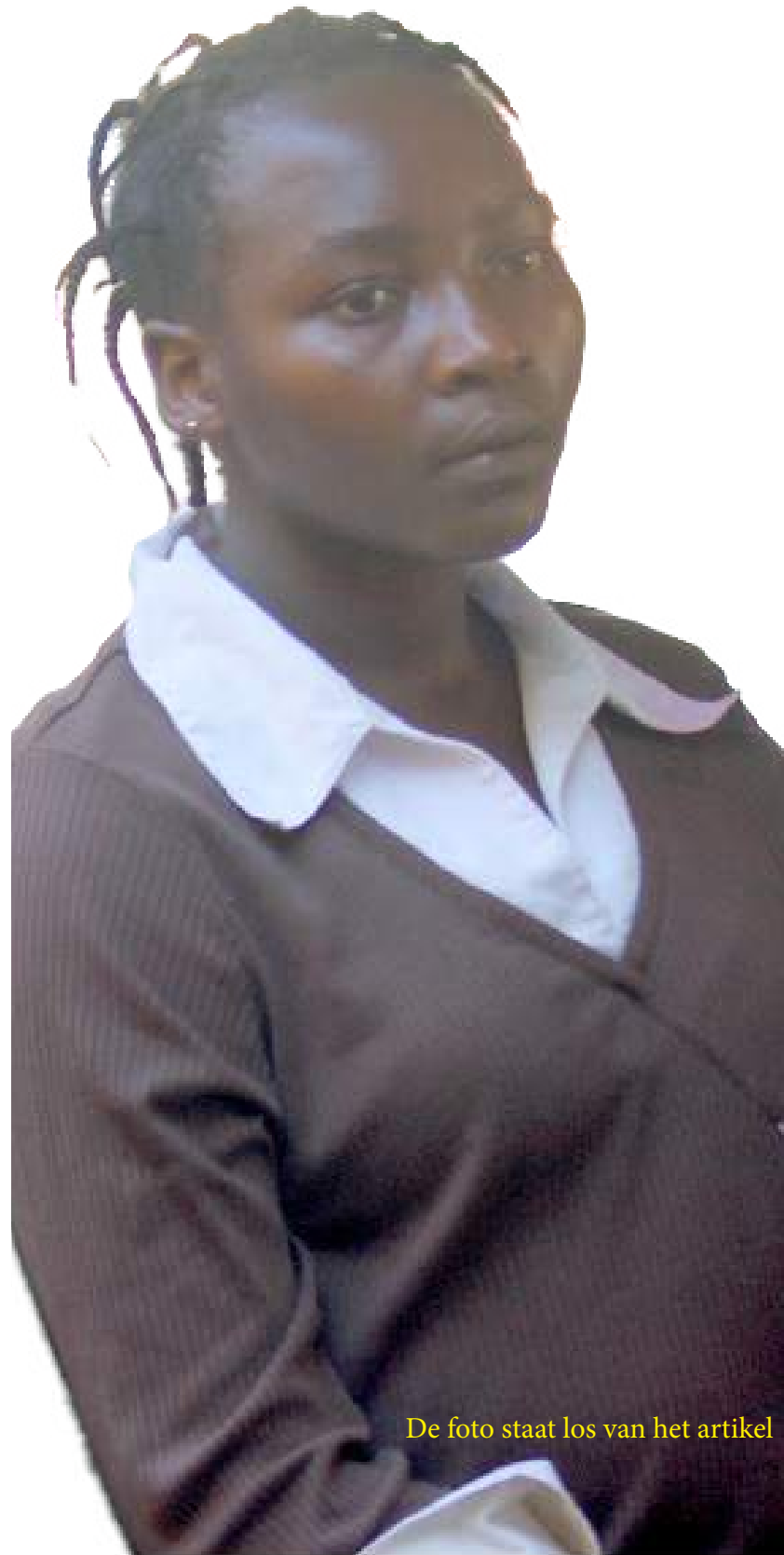
De foto staat los van het artikel