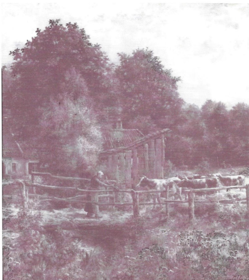
PRES D'UN MOULIN

Cette 8ème JOURNEE DU PATRIMOINE est organisée par l'administration communale de Droogenbos avec la collaboration de "Sicca Silva Droogenbosch", Cercle d'Histoire et de Folklore.