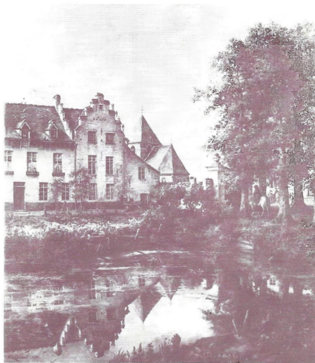
L'ENTREE D'UN VIEUX MANOIR BRABANÇON PEINTURE SUR TOILE DE MARIE COLLART (1890)

Adresse : Maison Communale, 2ième étage, Grand'Route 222, 1620 Drogenbos. Tél : 02/377 42 65.