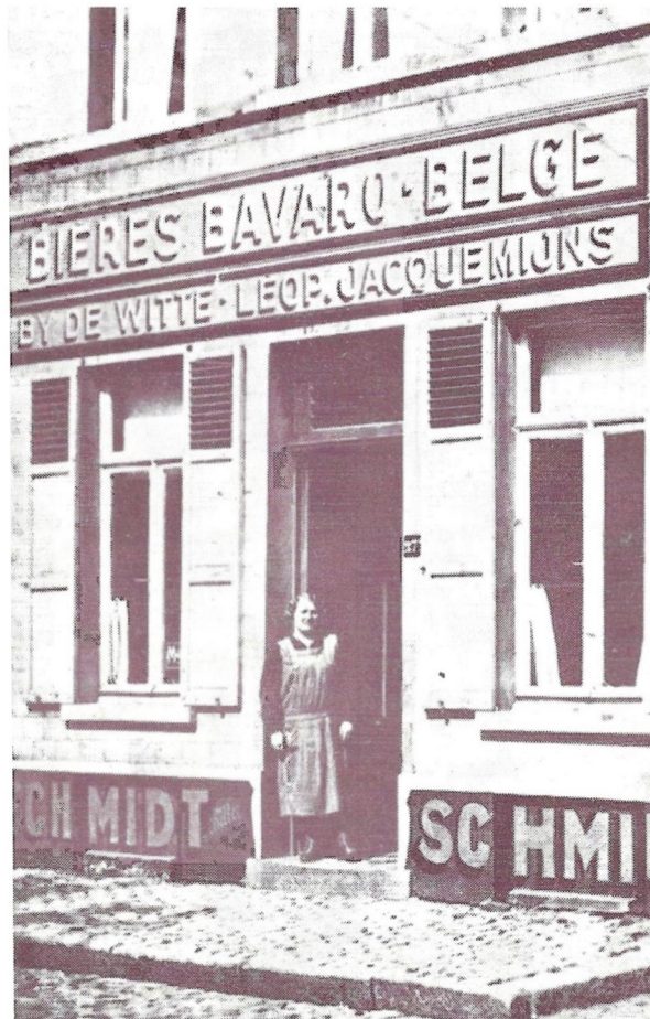
CAFÉ "OUD DROOGENBOSCH", VROEGER BIJ "DE WITTE", WAAR DE MUURSCHILDINGEN TE BEZICHTIGEN ZIJN.

Deze 8e OPEN MONUMENTENDAG wordt georganiseerd door het gemeentebestuur in samenwerking met de Heem- en Geschiedkundige Kring "Sicca Silva Droogenbosch".