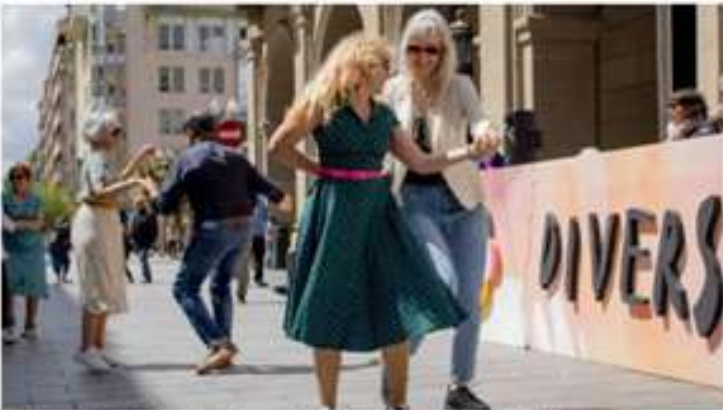
El acto de clausura de Diversario ha acabado con música en la calle.

H. A. NOTICIA / ACTUALIZADA 11/5/2025 A LAS 23:18