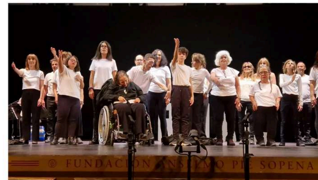
Los actores saludan desde el escenario tras la representación de "Normal", dentro de Diversario.