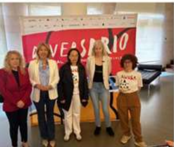
Un grupo de DPH participando en la clausura del festival.