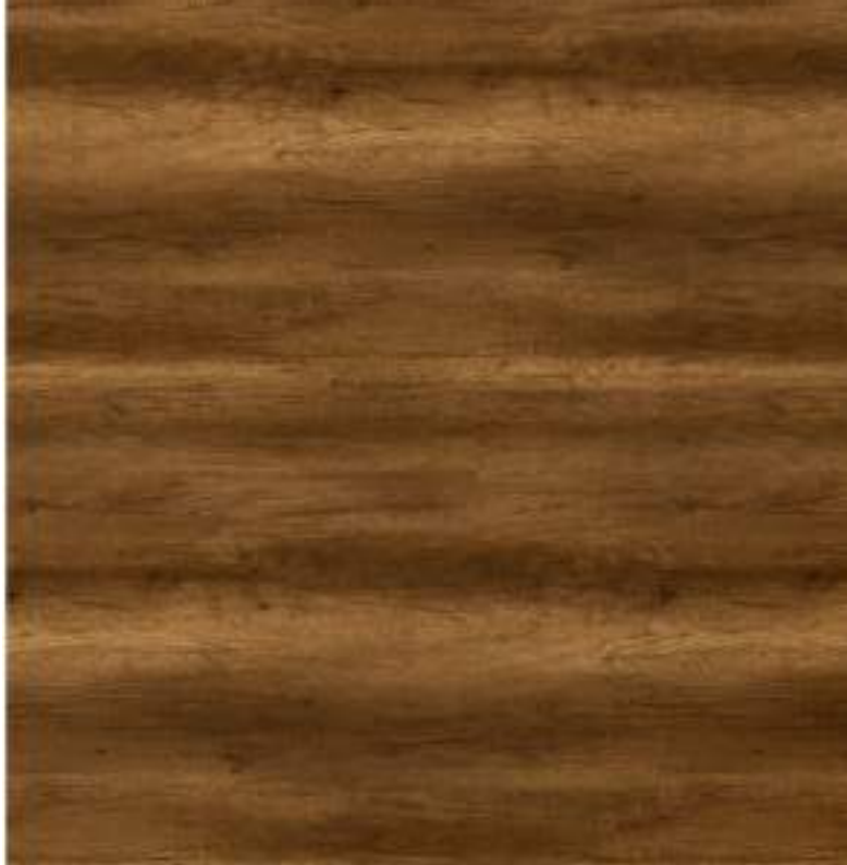
04 MUEBLES COCINA7 MADERA CARAMEL / PELIKANO