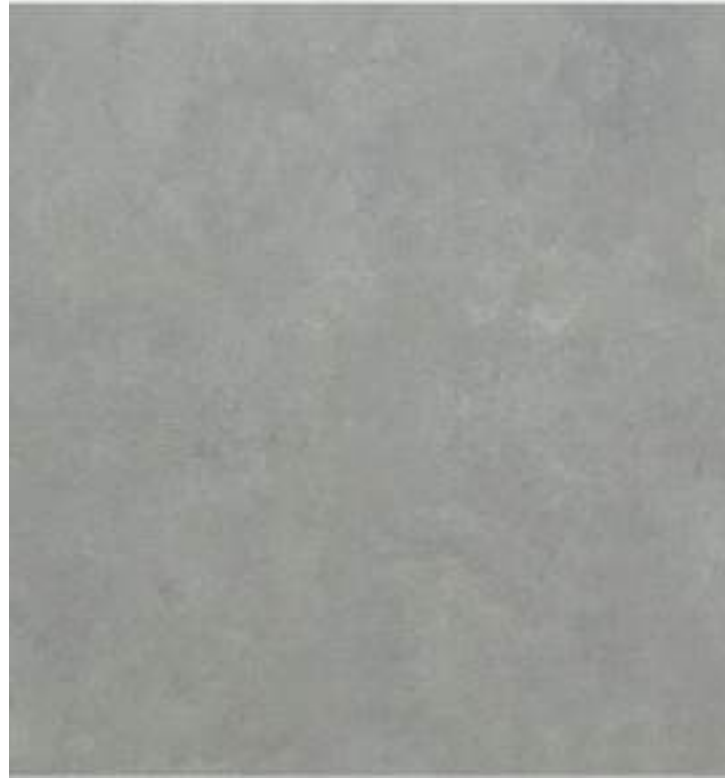
02 TERRAZA PISCINA / BAÑOS Cerámica Para Pisos Estilo Cemento Stage Steel 60x60 Gris /DECORCERAMICA /CORONA