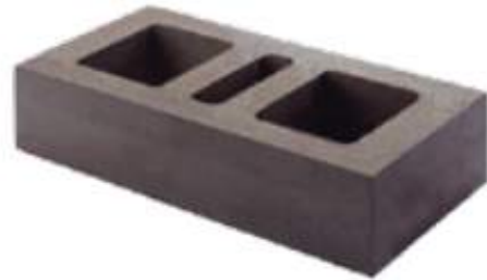
Ladrillo Prensado Liviano 6 cm Cocoa H