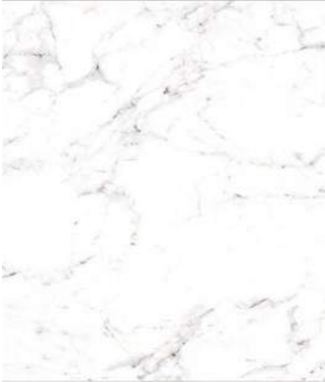
01 INTERIOR PISOS Bianco Carrara / staturio vennato. 60*30 / DECORCERAMICA