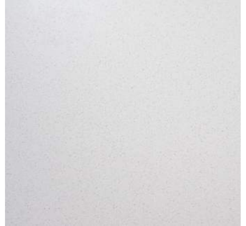
06 MESONES Quartztone BLANCO POLAR / GRAMMAR