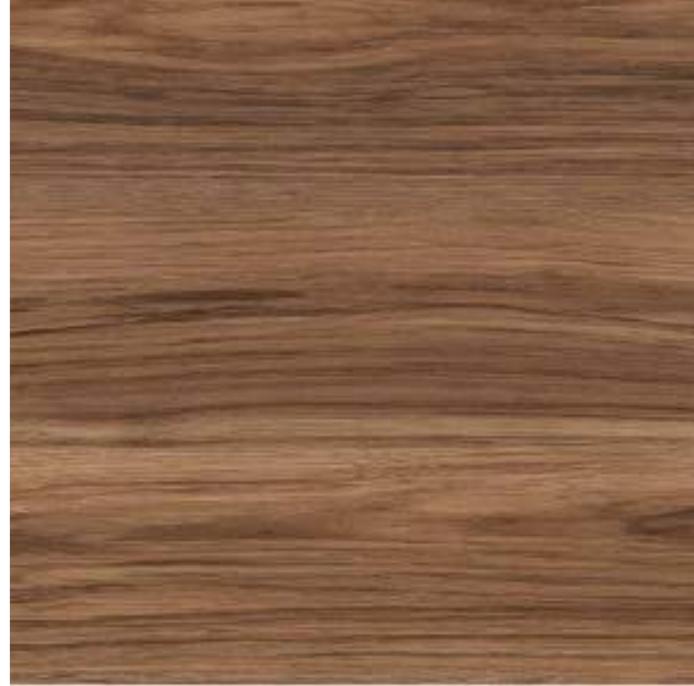
05 PUERTAS ENCINO MARRÓN / PELIKANO