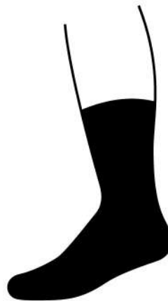
CREW ถุงเท้าที่มีความยาว ขึ้นมาถึงบริเวณน่องส่วนล่าง เหมือนถุงเท้าที่เราใส่ทำงานกันทั่วไป