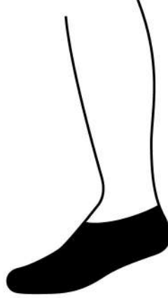
LOW RISE ต่ำกว่าตาตุ่ม เป็นถุงเท้าที่ยาวขึ้นมาอีก จาก No show แต่สั้นกว่า Low cut