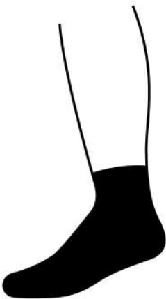
QUARTER/ MINI CREW ถุงเท้าที่มีความยาวขึ้นมาอีกระดับ คลุมเหนือข้อเท้า