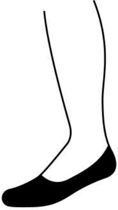
NO SHOW ถุงเท้าทรงซ่อน เวลาใส่รองเท้าจะไม่เห็น ถุงเท้าโผล่มาพื้นรองเท้า