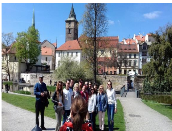
Școala pentru deficienți de auz, Plzeň, Cehia

Activități educative cuprinse în calendarul activităților județene și interjudețene