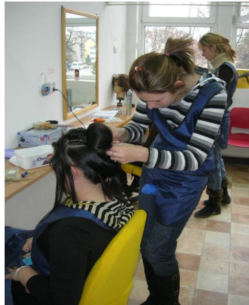
Atelierul de frizerie-coafură