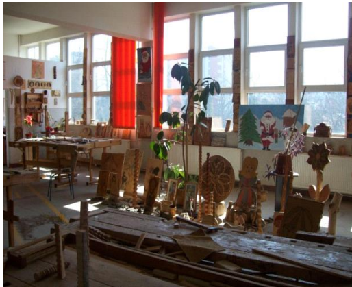
Atelierul de tâmplărie