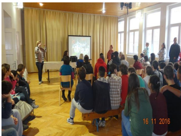
Școala „11 Mai” Jagodina