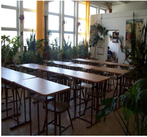
Atelierul de horticultură