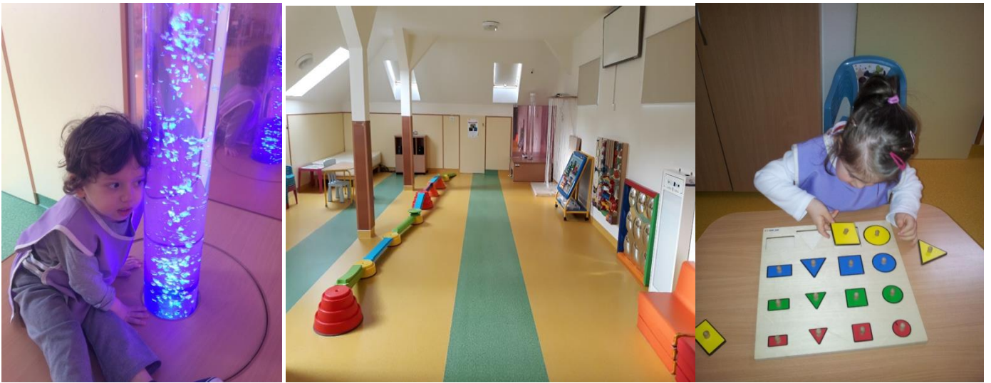
Camera de stimulare multisenzorială