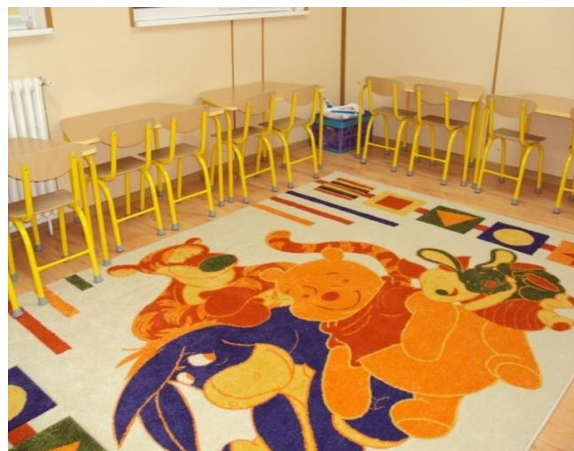
Săli de grupă